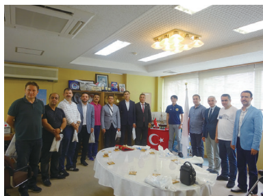
串本町 表敬訪問（地方行政官能力開発）