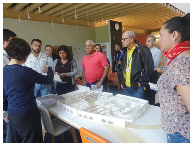
沼田町 視察（参加型地域開発）