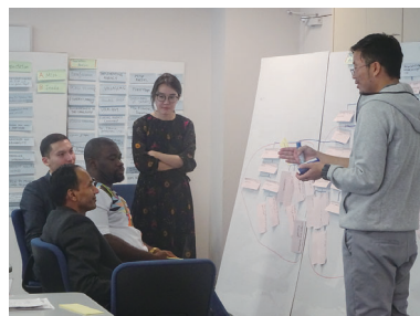
PCM 研修（地域開発計画管理）